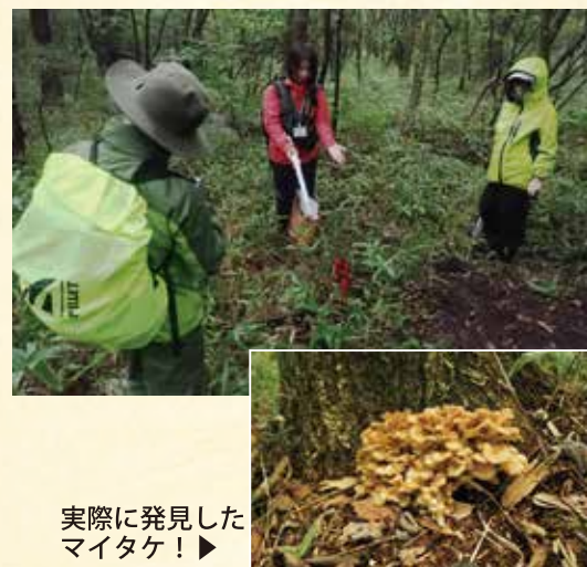
実際に発見したマイタケ! ▶