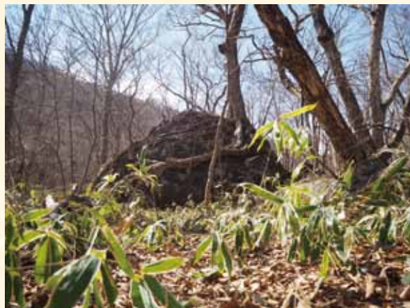
悠久の 時を 感じられる 場所です!