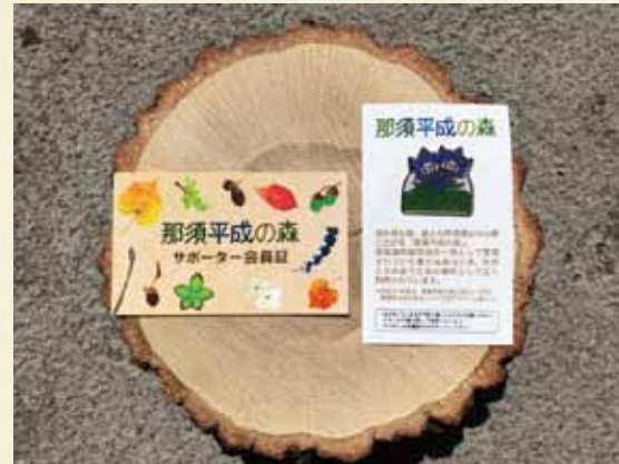
平成31年度ピンバッジは「リンドウ」

当基金では、那須平成の森における取組を応援して下さる「那須平成の森サポーター」を募集しています。平成30年度は72組99名のサポーターと来館者のご寄付に支えられ、活動することが出来ました。また、多くのサポーターの方が更新をしてくださり、前年度よりも那須平成の森を支えて下さるサポーターが増えました。この場をお借りして御礼を申し上げます。今年度も変わらぬご支援をお願いいたします。 (お問い合わせ電話番号:0287-76-2589)